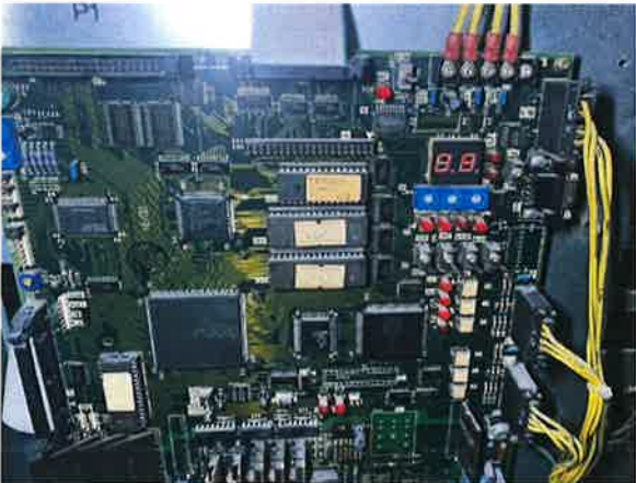
图 6：电梯主控电子板老化