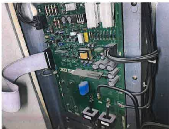
图 9：调速装置的驱动电子板老化