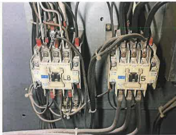
图 8：LB 和 5#接触器触点磨损烧蚀