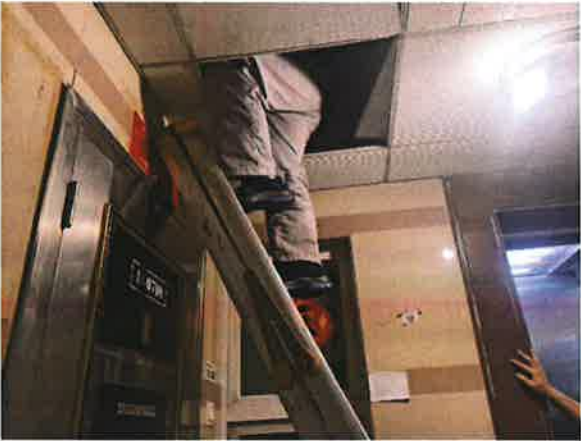
图 4：通往机房的通道不畅通