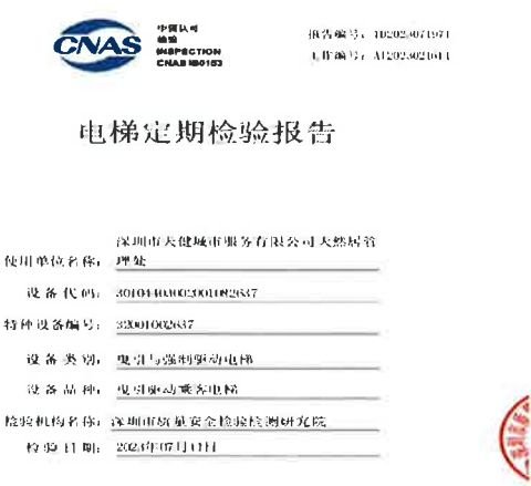
图 2：电梯定期检验报告