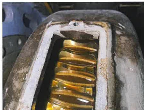
图 12：传动副啮合面未发现明显的啮合缺陷