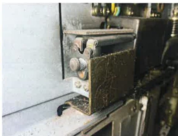
图 14：层门门锁电气开关触点氧化