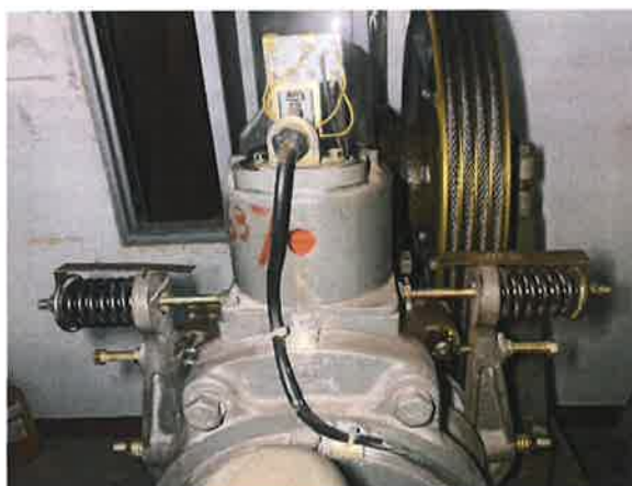
图 11：制动器仅由一组机械部件（铁芯）组成