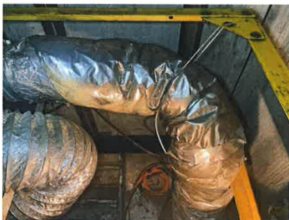
图 13：轿顶护栏设置不符合现行标准