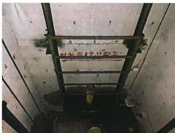
图 16：底坑对重运动区域防护不符合现行标准