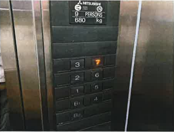
图 3：轿厢部分召唤按钮动作不良