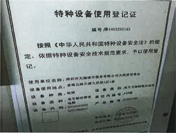
图 1：电梯使用登记证