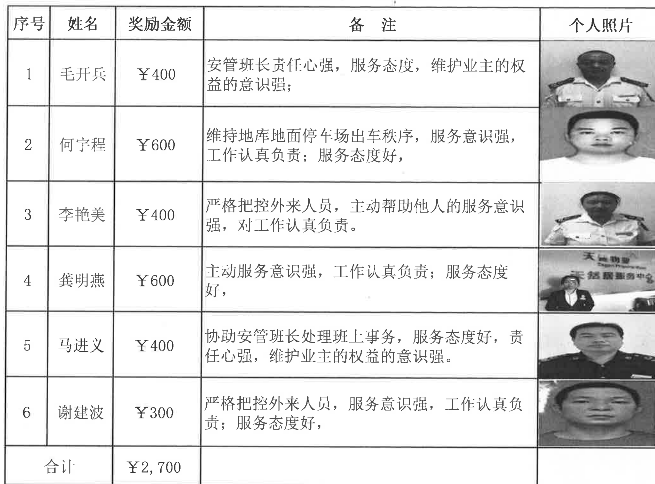
天然居2022年11月份门岗奖金发放明细表