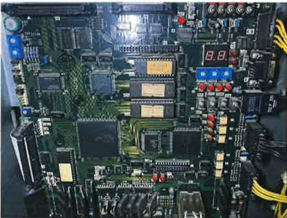
图 6：电梯主控电子板老化