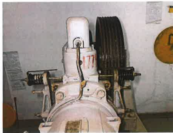
图 10: 制动器仅由一组机械部件（铁芯）组成