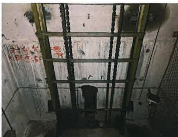
图 18: 底坑对重运动区域防护不符合现行标准