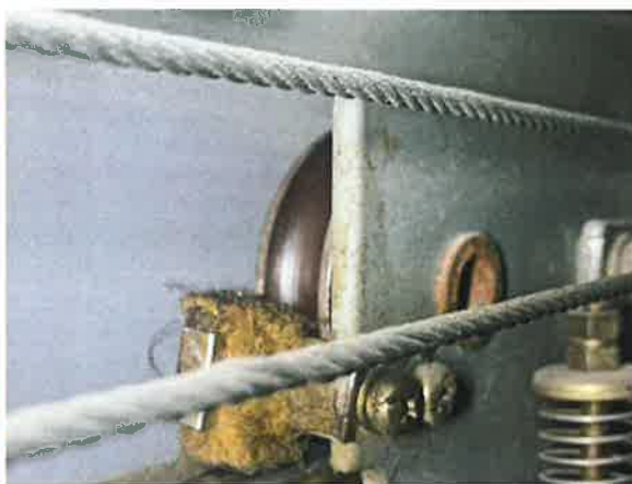
图 14: 轿门门挂轮导向胶老化