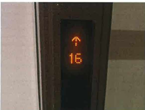
图 17: 部分楼层显示电子器件老化显示不全