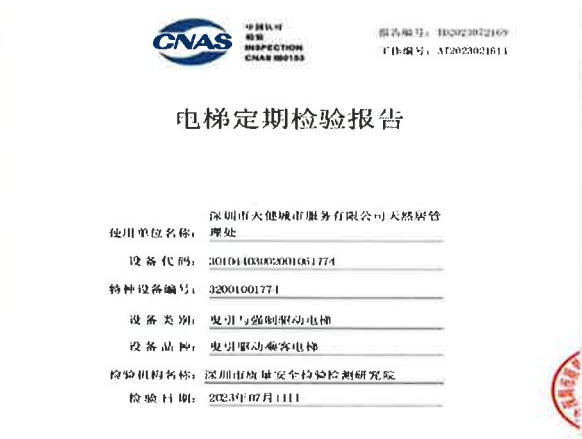
图 2：电梯定期检验报告