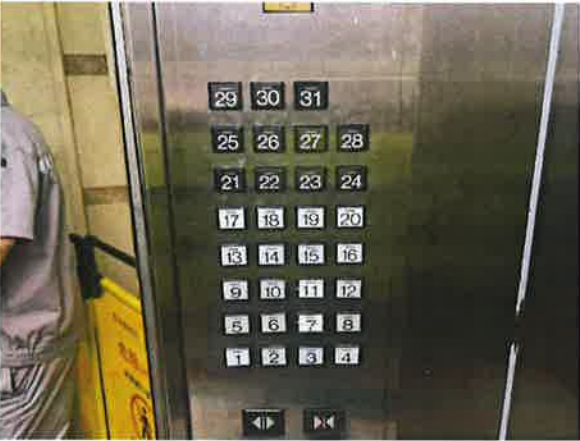
图 3：轿厢部分召唤按钮动作不良