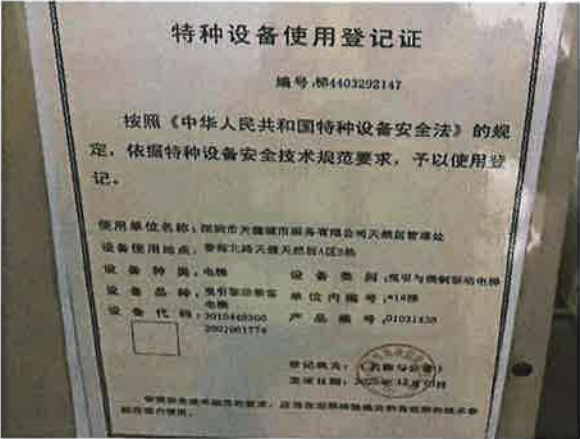
图 1：电梯使用登记证