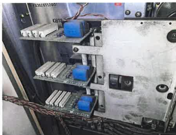
图 8: 调速装置的驱动电子板老化