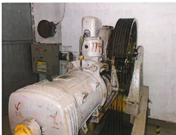
图 9: 曳引主机