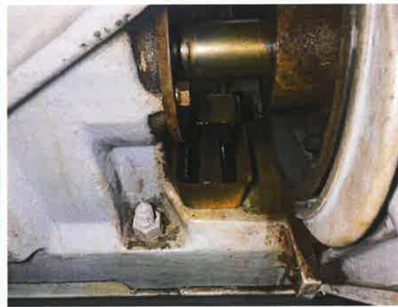
图 12: 减速箱密封不良, 存在渗漏油现象