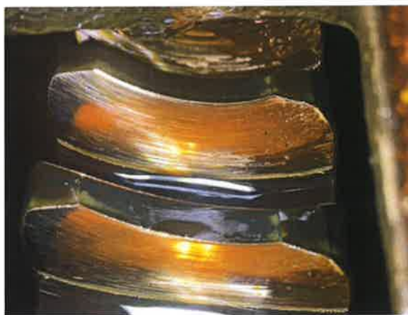
图 11: 传动副啮合面存在明显的啮合磨损缺陷