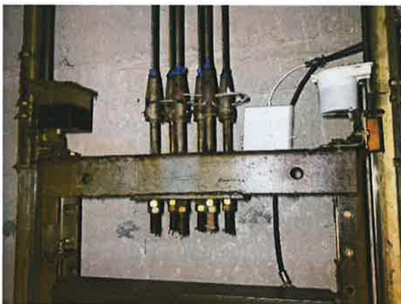
图 15: 绳头组合无弹簧缓冲装置