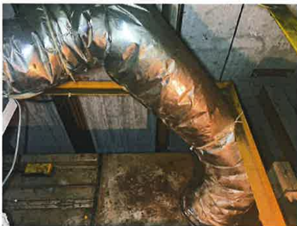
图 13: 轿顶护栏设置不符合现行标准