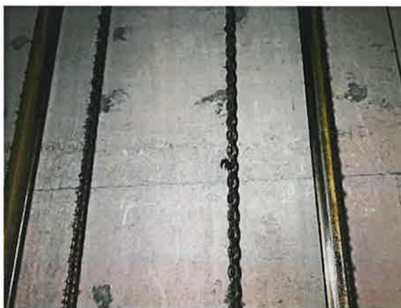
图 16: 重量补偿装置链环消音绳存在锈蚀断裂